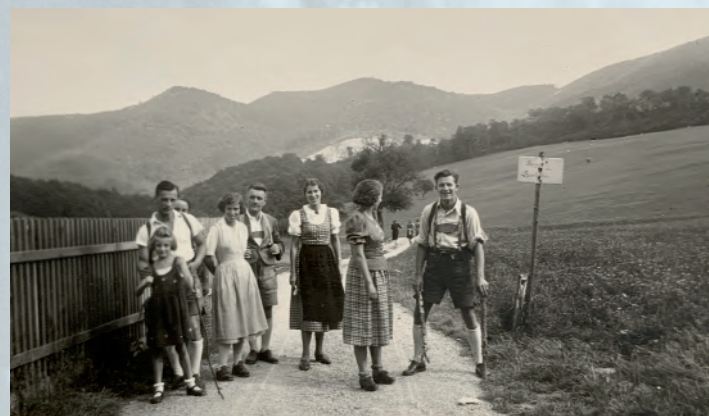
Uhodnete, co znamená: „Pani houzmástrová pucovala na gonku štiflata“? I takhle se mohli bavit vídeňští Češi mezi sebou. Mluvit tu česky, tu německy a tu směsící obou jazyků bylo naprosto normální. A nosit k tomu typický německý kroj trachtl s koženými kalhoty a kšandami jakýmsmet.