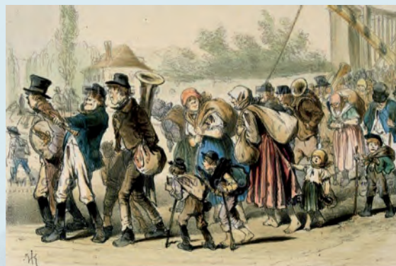
Ve vyprávění našich prababiček a pradědečků se velmi často opakuje tvrzení, že buď dotyční sami, nebo třeba jejich rodiče „chodili za prací do Vídně“, nebo „byli ve Vídni sloužit“. Zejména z chudších oblastí jižní Moravy či Čech to ve své době byla tak rozšířená móda, jako je dnes běžné jezdit na zkušenou na Erasmus.

Víte, že největším českým městem ještě na začátku 20. století byla Vídeň? Žilo v ní víc Čechů než v Praze. Po rozpadu habsburské monarchie v roce 1918 se desetitisíce Čechů žijících ve Vídni ocitli na území cizího státu. „Obyčejní“ lidé se tak museli vypořádat s celou řadou společensko-politických problémů, které jim byly do té doby cizí. Zároveň si vídeňští Češi museli najít své místo uprostřed rakouské společnosti. Využívali k tomu mimo jiné mimořádně aktivní společenský a spolkový život v rámci menšiny, ale také posilovali svou identitu četnými přeshraničními kontakty s občany Československa – ať už šlo o návštěvy v zahraničí během dovolených nebo výlety na sokolské slety. Ve skutečnosti se nacházeli v situaci, kdy nebyli považováni ani za Čechy, ani za Rakušany. Svěbytná česká vídeňská komunita prakticky zanikla s koncem druhé světové války. Dnes po ní ve Vídni zůstala jen četná česky znějící jména všech těch Prohasků, Spacků, Swobodů a podobně.