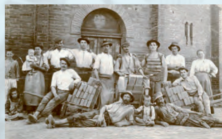
Co platí o kuchařkách, lze říci o stavebních dělnících. V dobách, kdy se Vídeň ve velkém velkoryse přestavovala do podoby metropole rozsáhlého impéria, bylo potřeba dvou věcí: stavebních dělníků a cihel. Obojí dodávali čeští imigranti. Dokonce se vžil pro Čechy ve Vídni pojem „Ziegelböhmee“, neboli cihloví Češi.