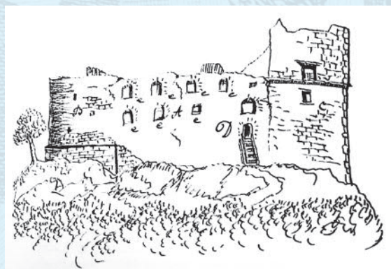
Radyně. Přiblížili jsme se k lesu, který obklopuje zemskou silnici z obou stran, a vlevo spatřili trosky hradu Radyně, jak se – temně a chmurně – tyčí nad tmavým lesem a zvou nás k návštěvě. Karel Kramerius 31. srpna 1814