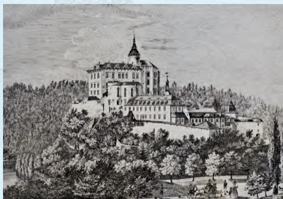
Frydlant. Roku 1801 došlo k nevidané věci – Clam-Gallasové zpřístupnili část svého hradu Frydlant pro veřejnost a představili jim zde první veřejnou expozici.