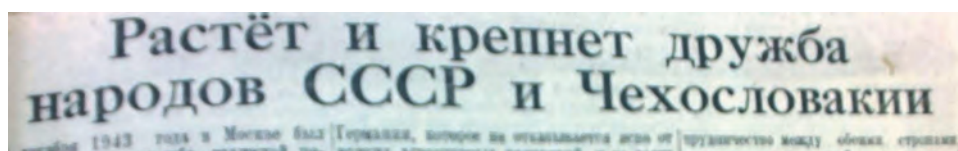
Roste a sílí přátelství národů SSSR a Československa (Pravda 14. 12. 1943)