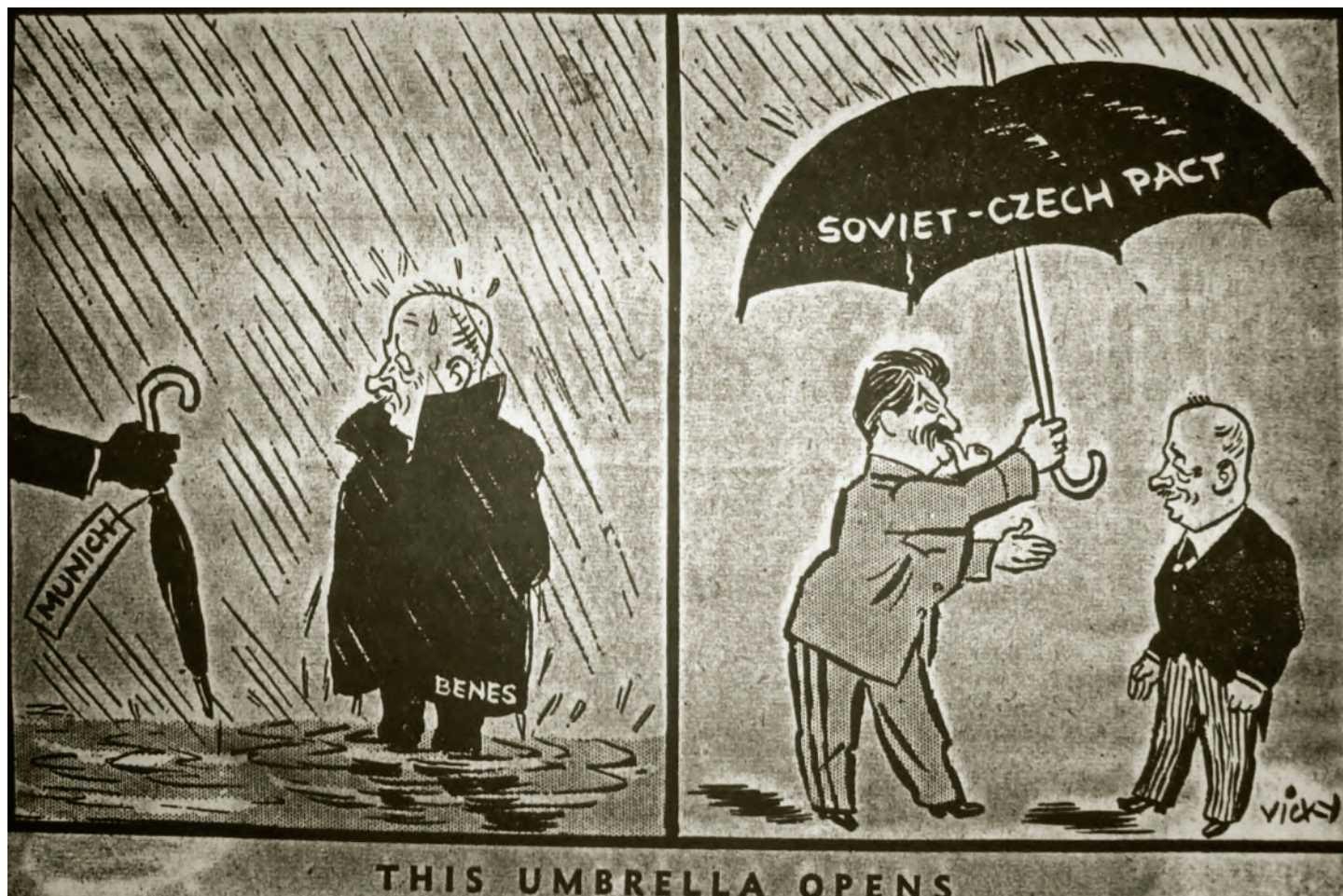
Karikatura k podpisu smlouvy z britského listu News Chronicle 14. 12. 1943