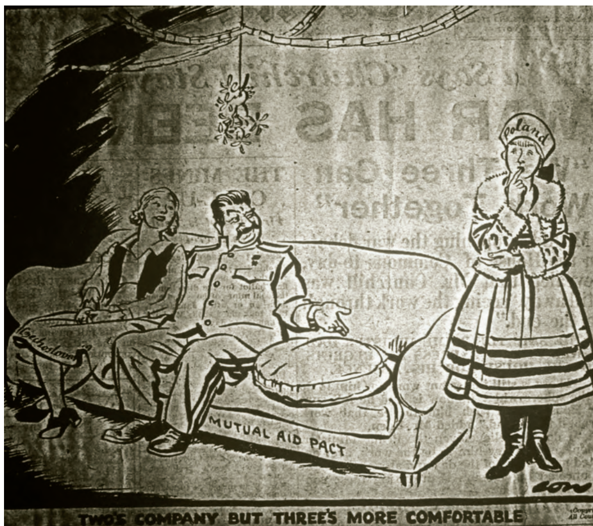
Karikatura k československo-sovětské smlouvě z britského listu Evening Standard 14. 12. 1943