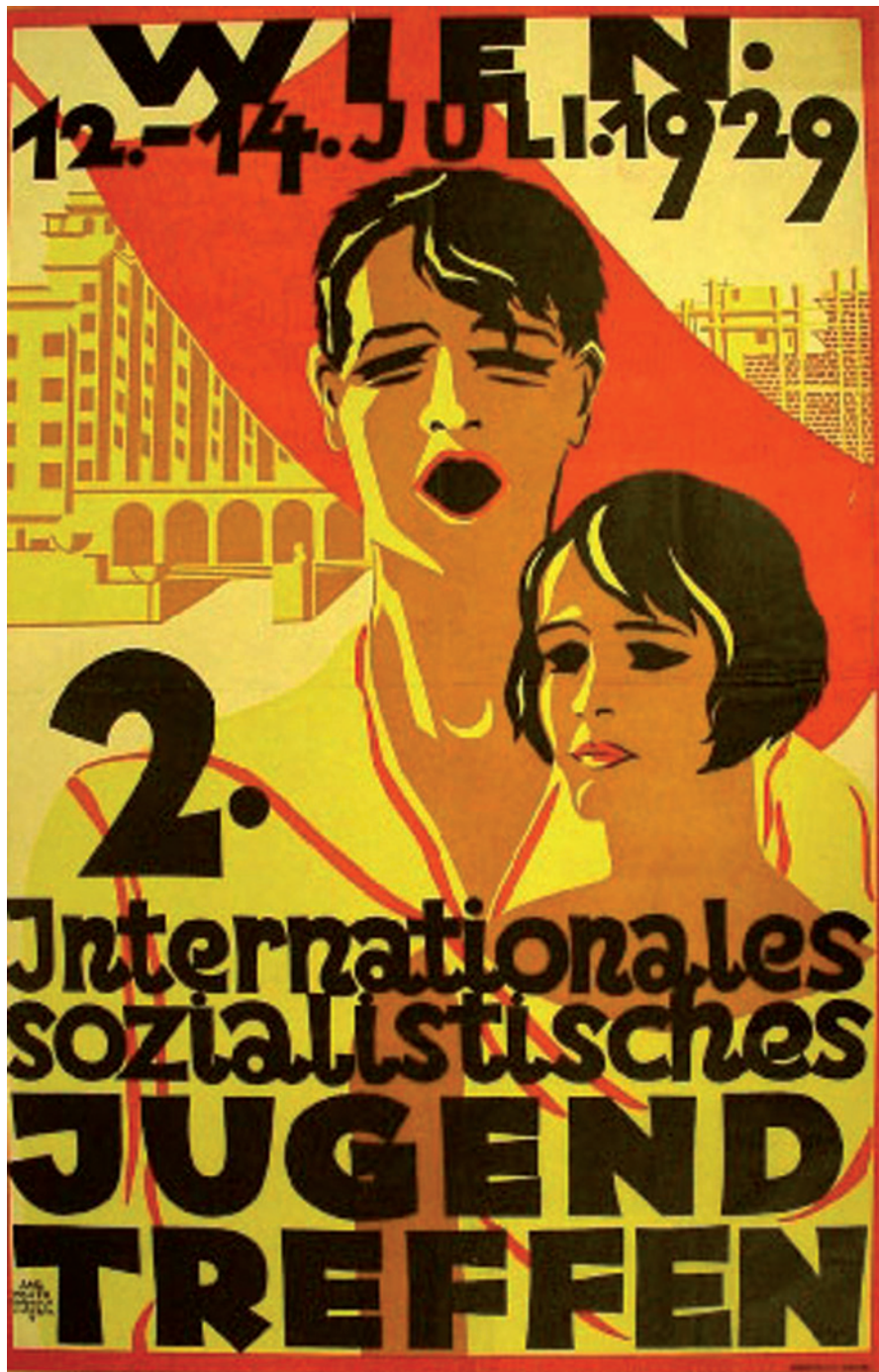
4) VGA, Wien, Plakatsammlung