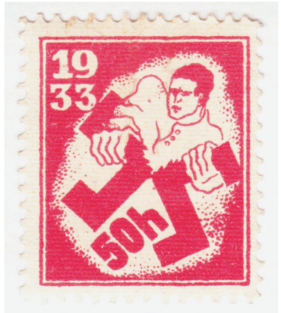
5) Národní archiv, Policejní ředitelství Praha II – prezidium